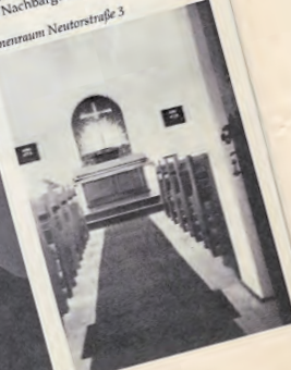
Innenraum Neutorstraße 3