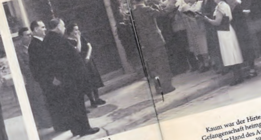
Bruchsal Neutorstraße 3